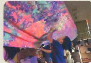
“本物”の体験と豊かな自然の中で、こどもたちの 「やってみたい」が育ちます