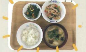
食べることは生きること 食事を通して、五感を使って味わう 出汁、旬の食事を大切にしています。